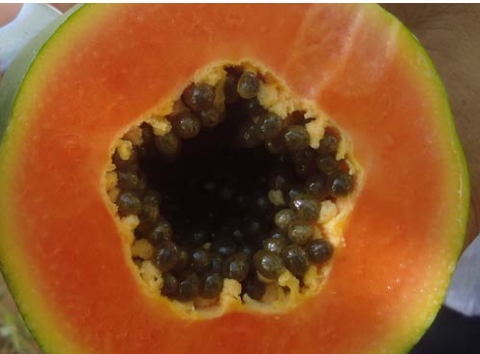
Fruto do mamão cv. Calimosa (Grupo Formosa) tipo exportação (cor vermelho, pouca semente, bom rendimento de polpa)

O trabalho de avaliação agrônômica leva em consideração diversas características das plantas, tais como: altura; diâmetro do caule; número de flores deformadas, estéreis e normais; número de frutos; peso médio de frutos comerciais em estágio de maturação etc. Segundo os pesquisadores, o experimento ainda está na fase de colheita e um novo ensaio deverá ser feito para medir os resultados.