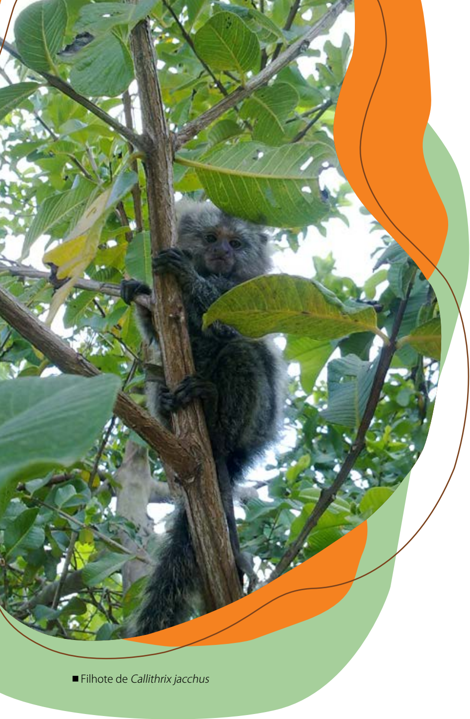
■ Filhote de Callithrix jacchus

Uma pesquisa com os chamados “saguis-do-nordeste” ( Callithrix jacchus ), conhecidos no Maranhão como “soim”, realizada no município de Chapadinha (MA), está avaliando nesses animais uma outra característica, não verificada em outras famílias de primatas, mas típica de sociedades humanas extrativistas: a de utilizar estratégias de exploração para garantir alimento em abundância durante todas as estações do ano.