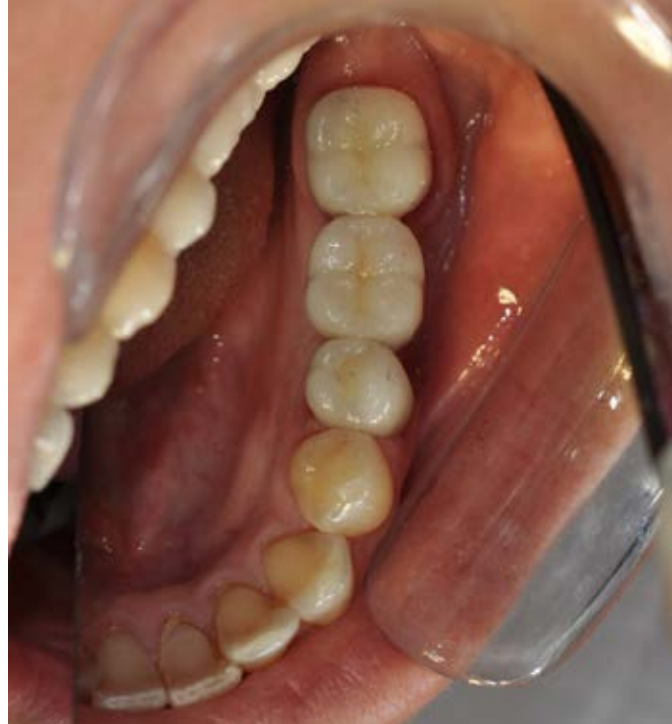
Além de mais biocompatíveis, as próteses cerâmicas apresentam vantagens estéticas.

ção”, conclui o pesquisador, que conta com o apoio da Fundação de Amparo à Pesquisa e ao Desenvolvimento Científico e Tecnológico do Estado do Maranhão (FAPEMA) e do Conselho Nacional do Desenvolvimento Científico e Tecnológico (CNPq).