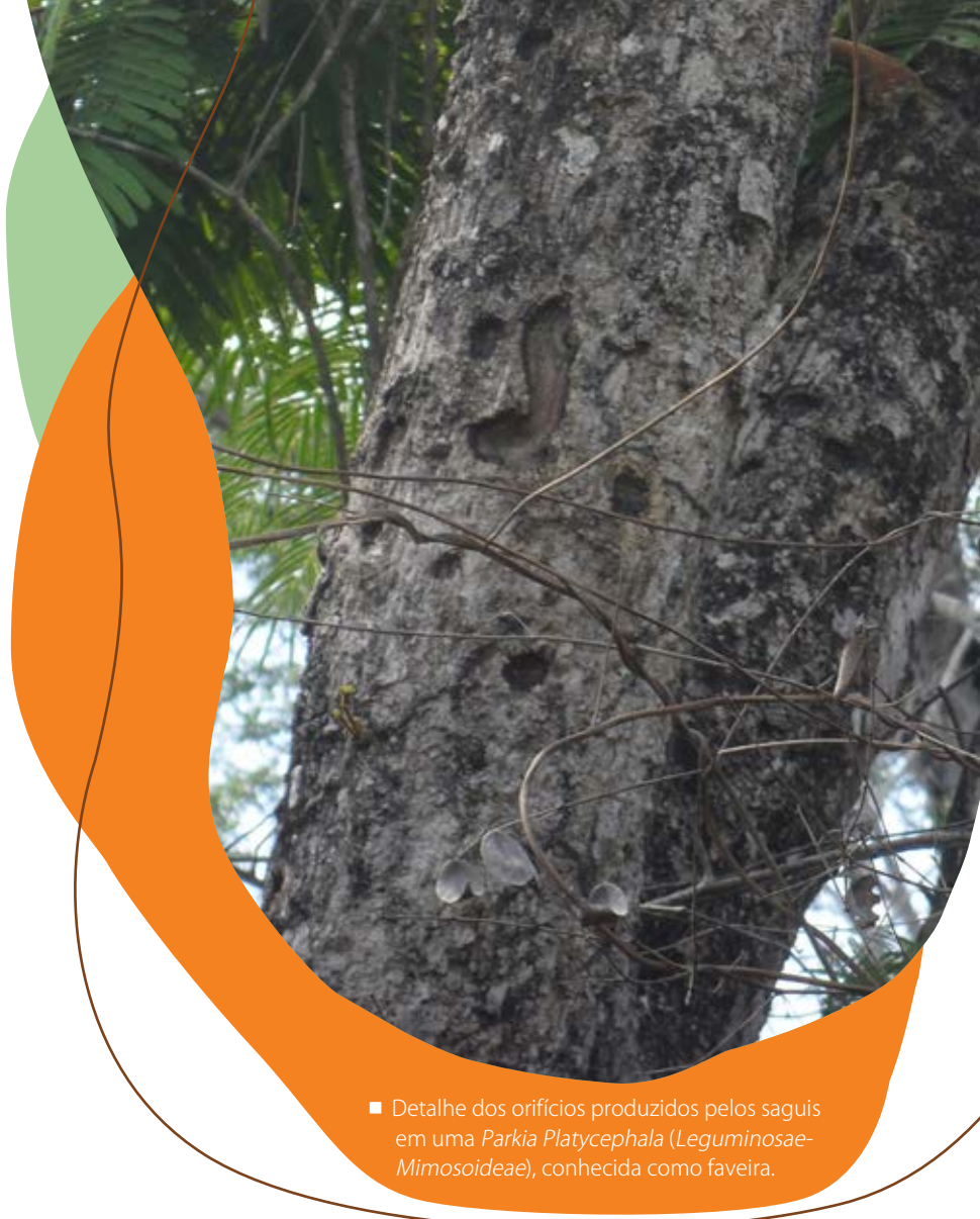
■ Detalhe dos orifícios produzidos pelos saguis em uma Parkia Platycephala (Leguminosae-Mimosoideae), conhecida como faveira.

“Esta é uma atividade extrativista em que o recurso não depende de determinadas épocas do ano para estar disponível. A resina é produzida a qualquer hora pela planta, bastando que o animal a estimule”, explica o pesquisador.