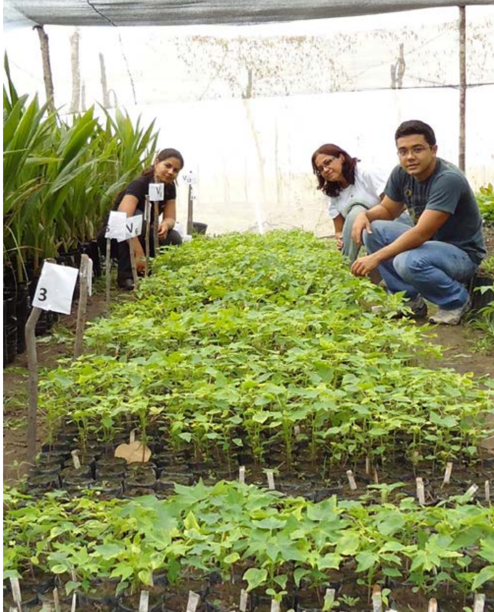
Instalação do experimento-viveiro. Preparo das covas em fileira dupla

rais e frutos com maior rendimento de polpa”, disse a pesquisadora.