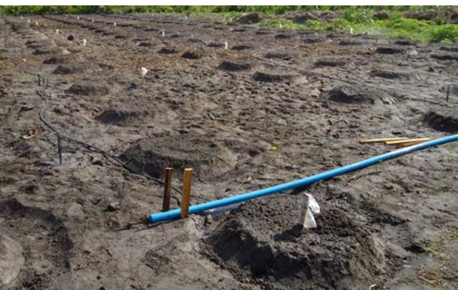
Viveiro-produção das mudas de mamão