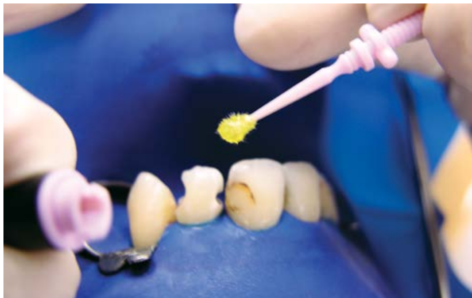
Sistema adesivo, utilizado para fazer a união do tecido dentário com a resina.

A pesquisa, que foi iniciada em 2009 e está em processo de conclusão, conta com a parceria da Universidade de São Paulo (USP) e da Universidade Estadual de Ponta Grossa (UEPG), no Paraná. “Já obtivemos bons resultados. Conseguimos estabilidade química ao aumentarmos o número de camadas dos adesivos e potencializamos o resultado com um maior tempo de fotoativa-